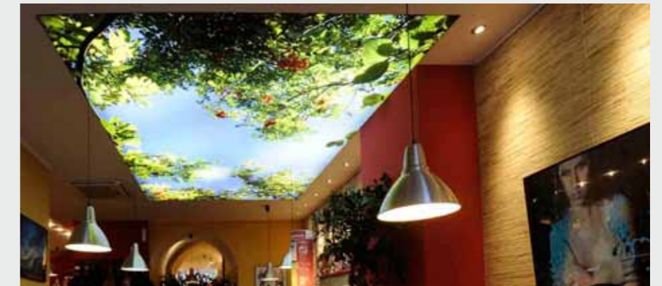
Matrix Frame®, Lichtdecke, 200 x 600 cm

Die Anwendungen reichen dabei von besonderen Wandbildern und kompletten Wandverkleidungen hin zu innovativen Trennwänden und außergewöhnlichen Lichtdecken.