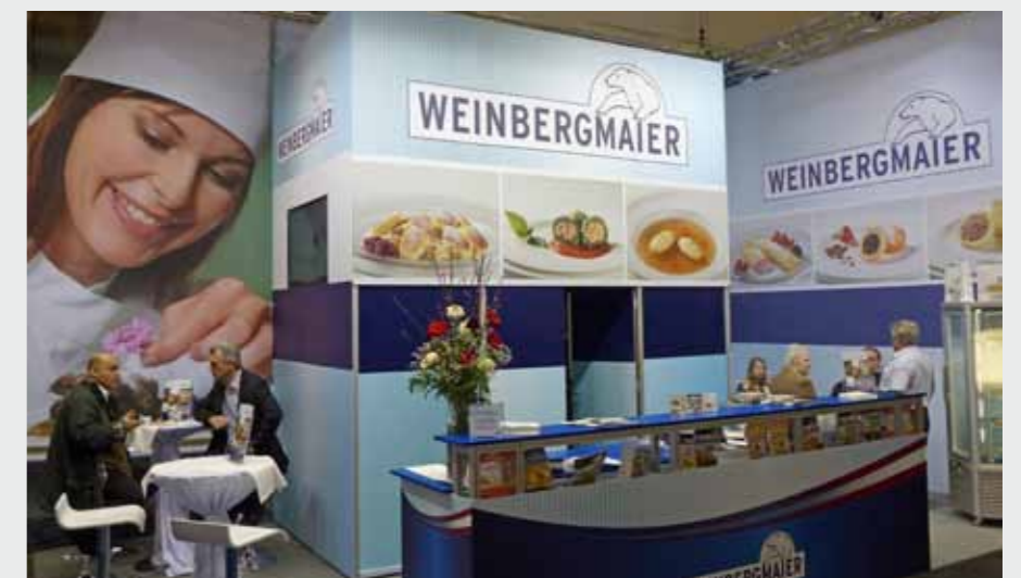
Matrix Frame®, Messestand, 1400 x 450 cm