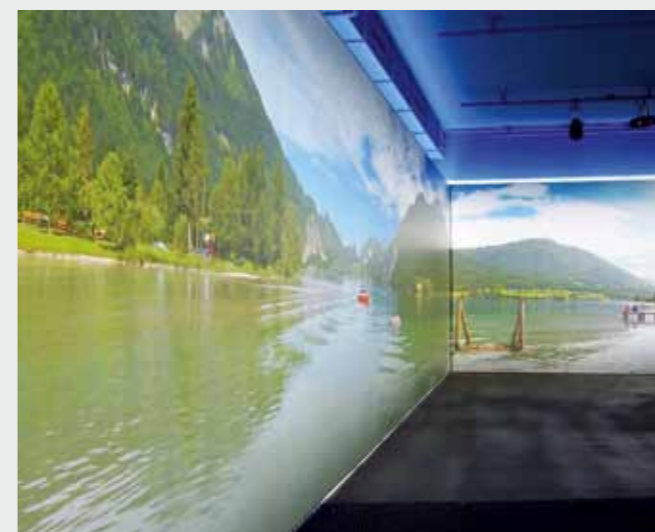
Matrix Frame®, LED LIGHT BOX, Wandmontage, 150 x 250 cm