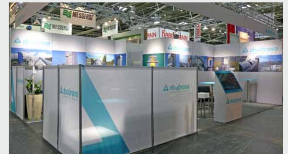
Matrix Frame®, Messestand, 1500 x 250 cm