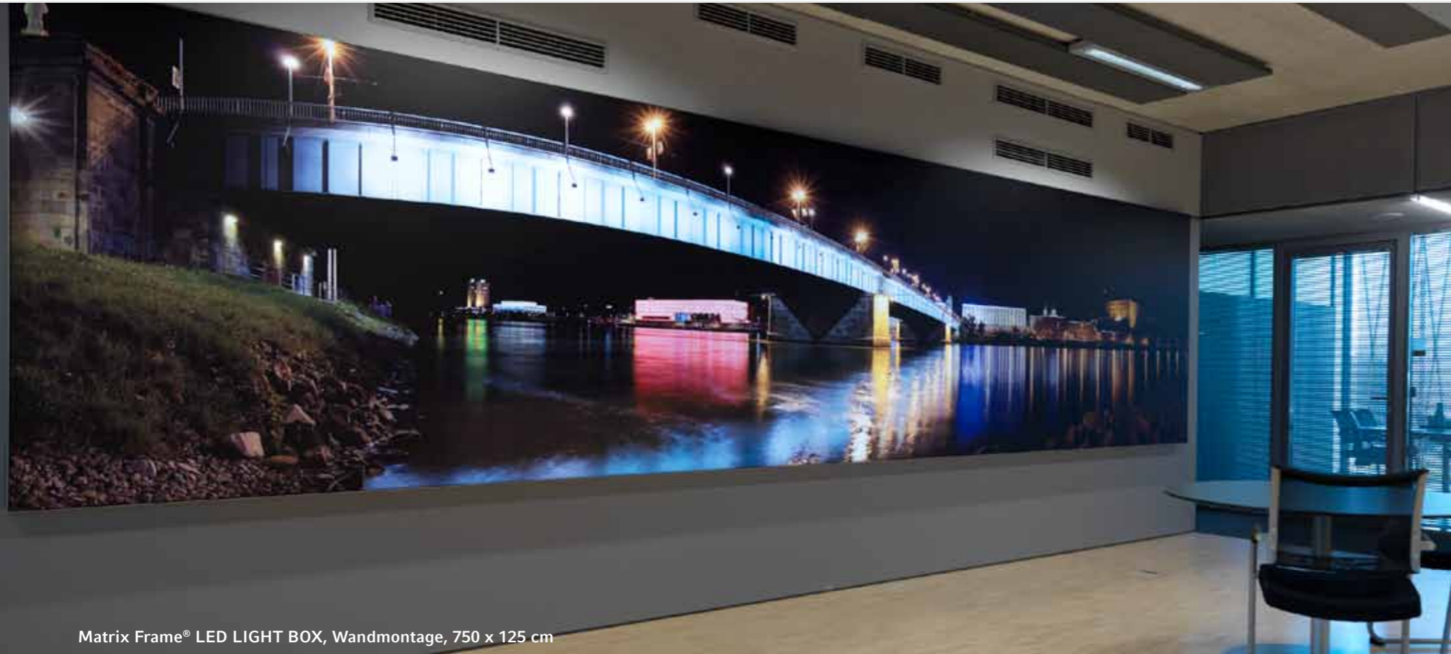
Matrix Frame® LED LIGHT BOX, Wandmontage, 750 x 125 cm

Matrix Frame® ist Ihr flexibles Rahmensystem für dekorative Inneneinrichtung – zur Verwendung an Decke, Wand oder freistehend, mit oder ohne Hinterleuchtung und Schalldämmung. In Kombination mit Digitaldruck zaubern Sie zudem Individualität in Ihre Räumlichkeiten.