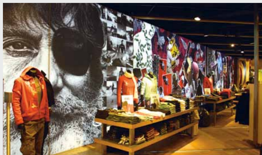
Matrix Frame®, LED LIGHT BOX, Wandmontage, 800 x 300 cm