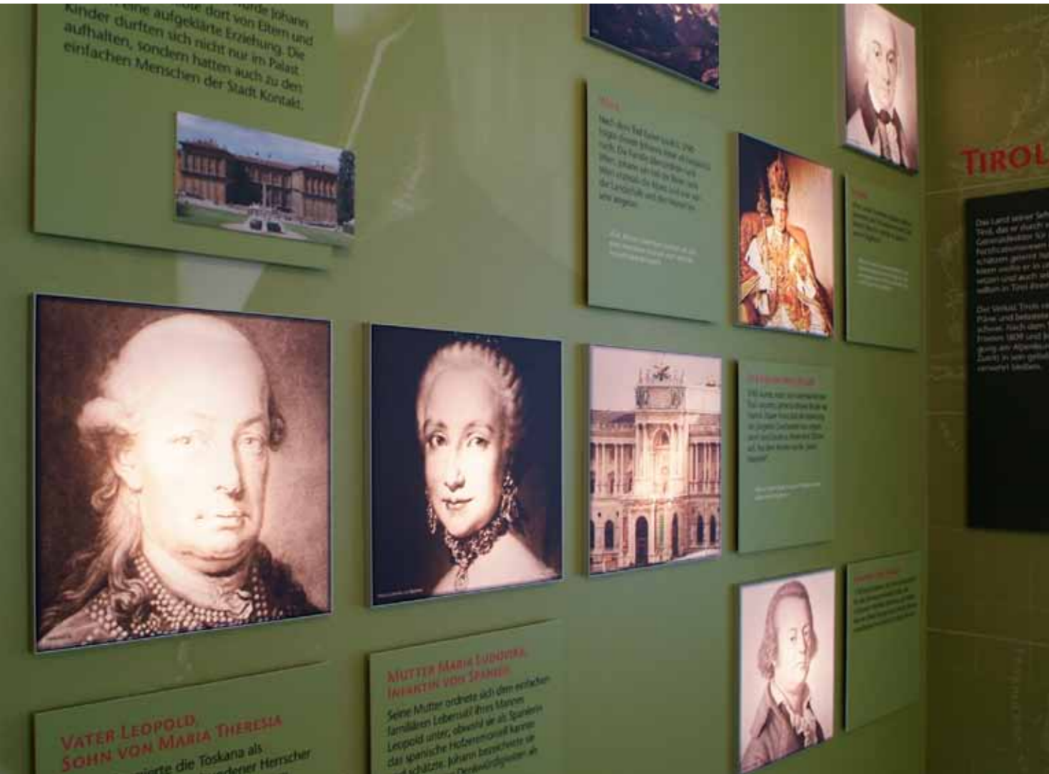
Matrix Frame®, Wandmontage, 30 x 30 cm