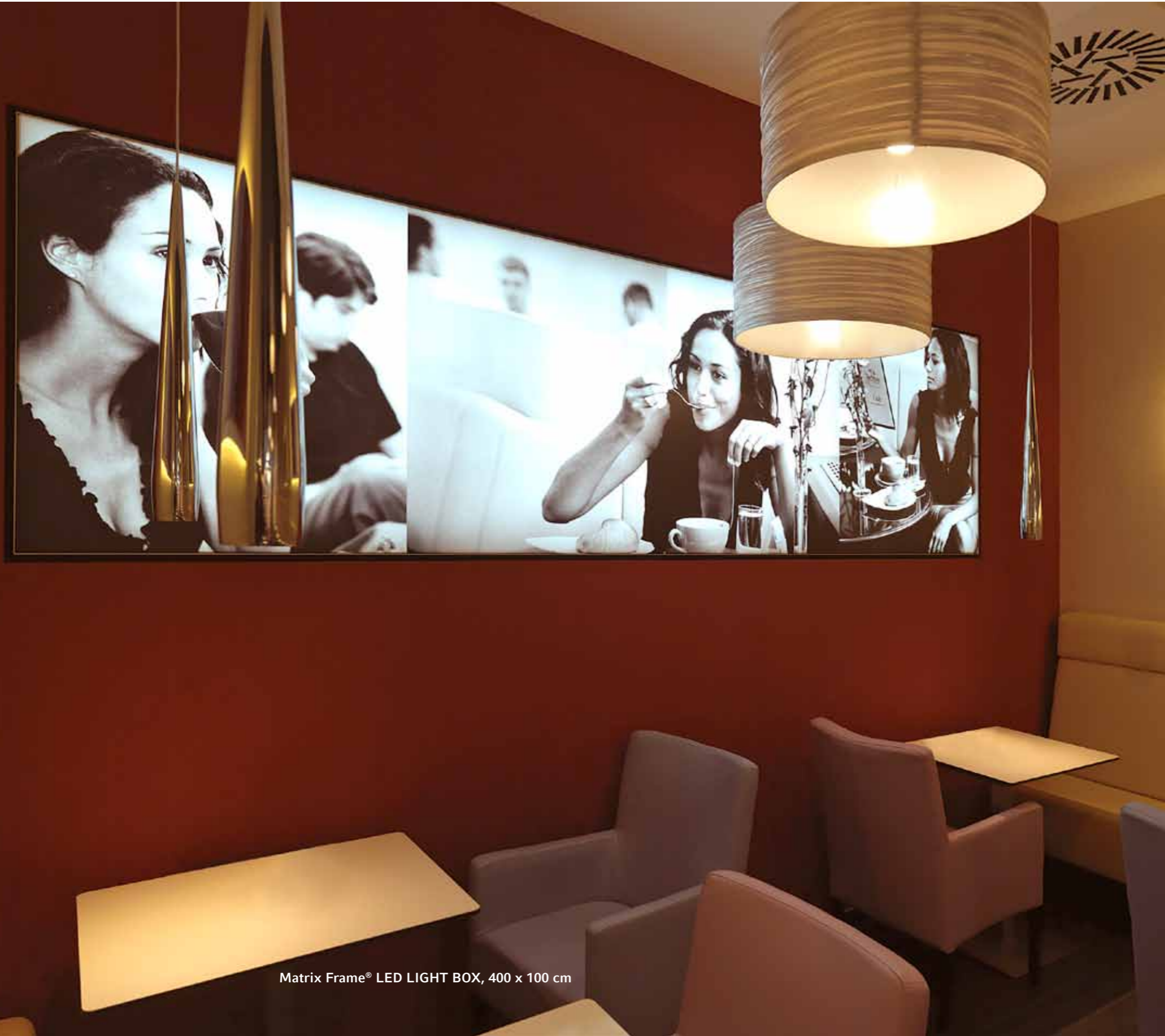
Matrix Frame® LED LIGHT BOX, 400 x 100 cm

Matrix Frame® ist die Kombination von digitalem Stoffdruck und einem einzigartigen Rahmensystem. Der bedruckte Stoff wird mittels einer angehängten Silikonlippe einfach in das Rahmenprofil eingedrückt. Das Wechseln der Dekorflächen ist somit kinderleicht.