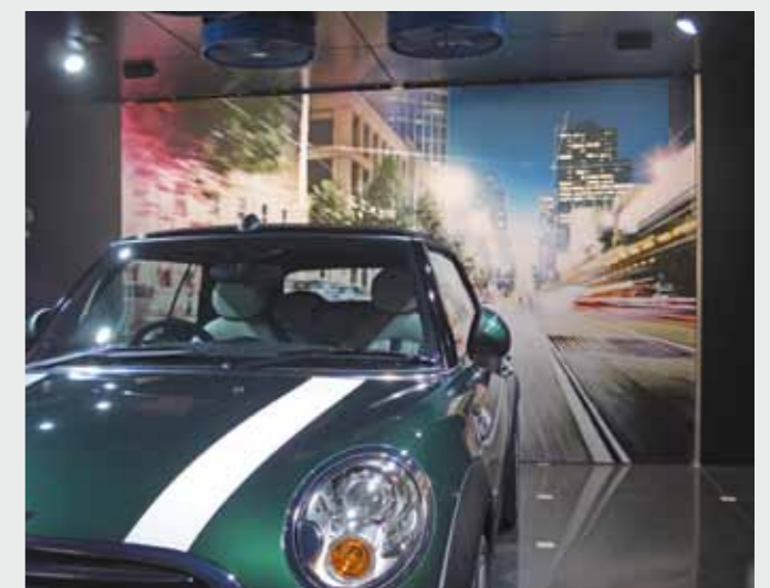
Matrix Frame®, LED LIGHT BOX, Wandmontage, 400 x 250 cm