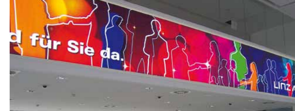
Matrix Frame®, LED LIGHT BOX, Wandmontage, 1000 x 120 cm