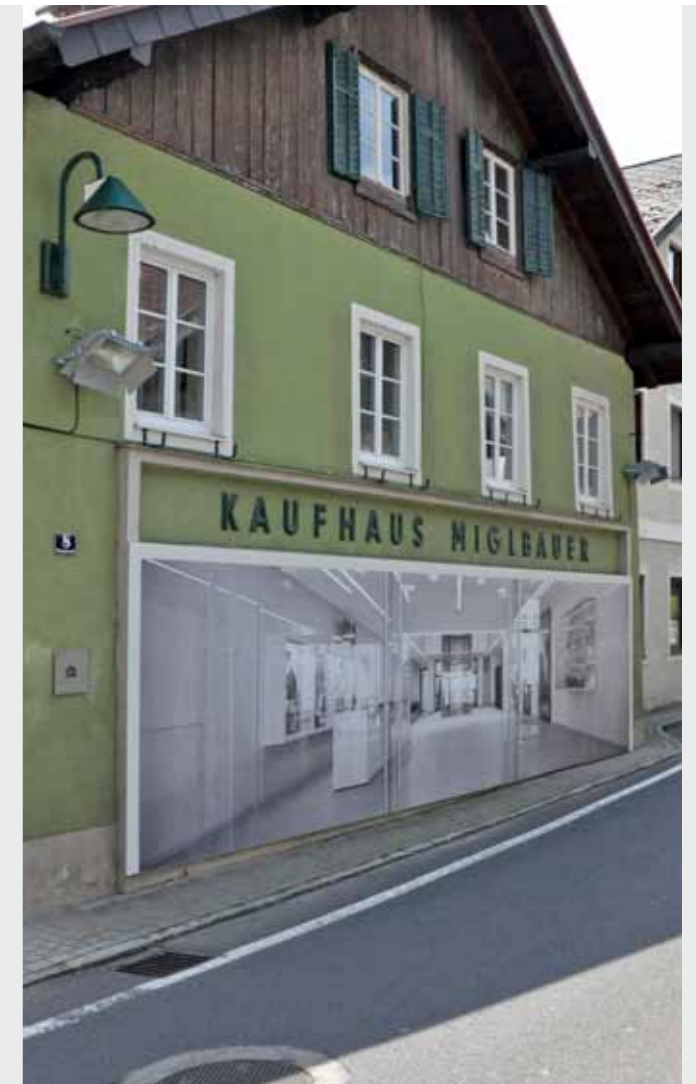
Matrix Frame®, Wandmontage, 9250 x 237 cm

Auf Grund der hochauflösenden und individuellen Digitaldrucke auf Stoff in Kombination mit dem flexiblen Alurahmensystem setzen Sie Akzente in der modernen Ausstellungsgestaltung. Matrix® Frame ist Ihre in Größe, Farbe, Profil und Dekoration flexible und projektspezifische Sonderlösung für außergewöhnliche Erlebniswelten.