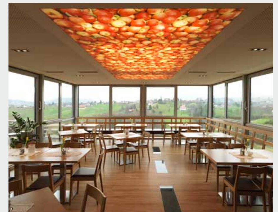
Matrix Frame®, Lichtdecke, 500 x 200 cm