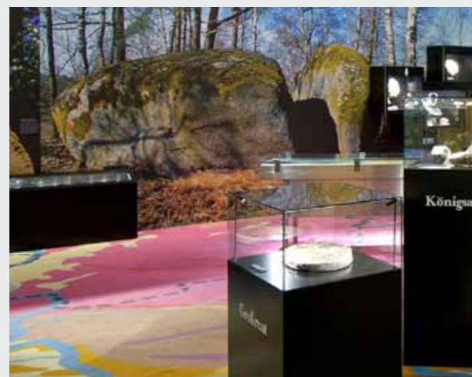
Matrix Frame®, Wandmontage, 1000 x 250 cm

Auf Grund der hochauflösenden und individuellen Digitaldrucke auf Stoff in Kombination mit dem flexiblen Alurahmensystem setzen Sie Akzente in der modernen Ausstellungsgestaltung. Matrix® Frame ist Ihre in Größe, Farbe, Profil und Dekoration flexible und projektspezifische Sonderlösung für außergewöhnliche Erlebniswelten.