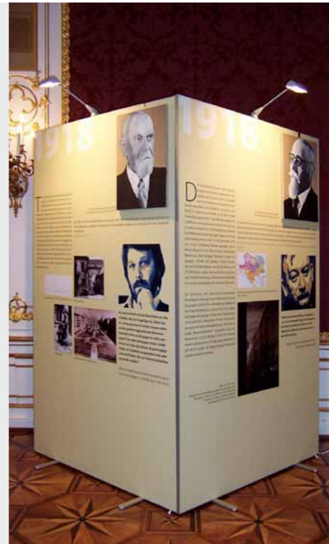
Matrix Frame®, Freistehend, 150 x 220 cm