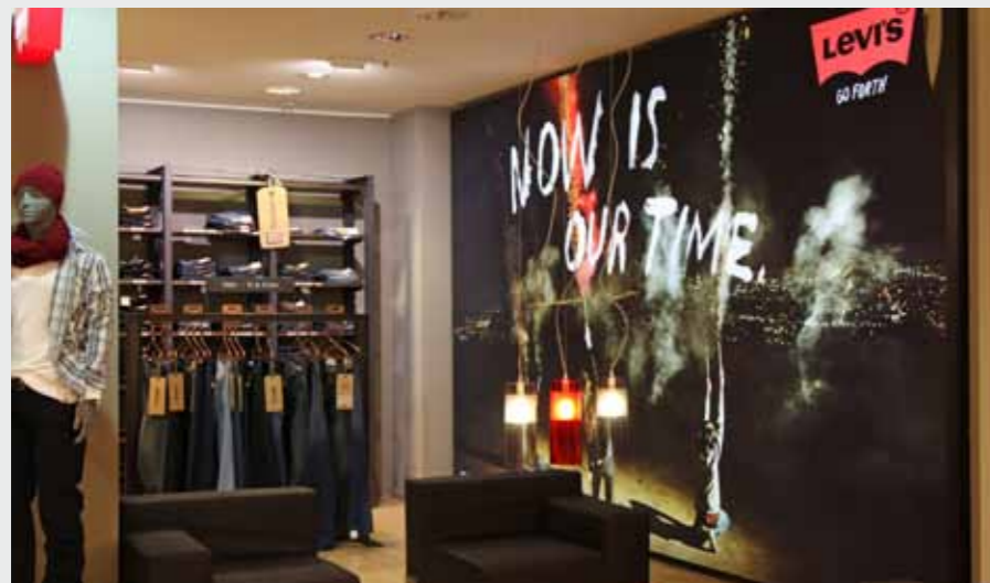
Matrix Frame®, LED LIGHT BOX, Wandmontage, 500 x 280 cm