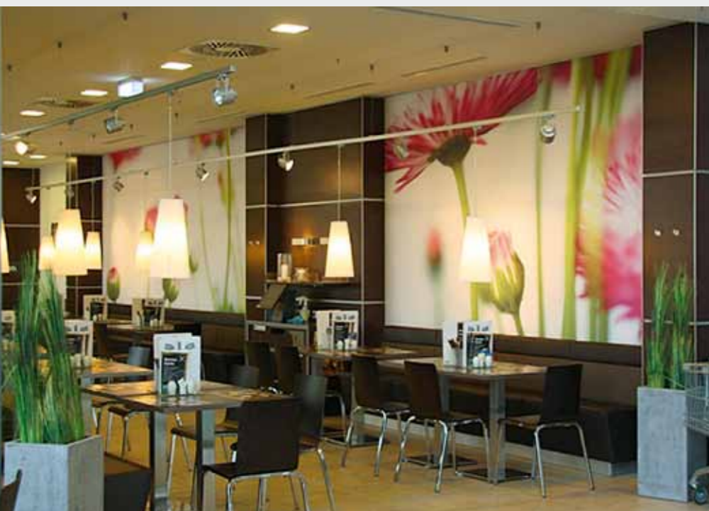
Matrix Frame®, Wandmontage, 450 x 300 cm