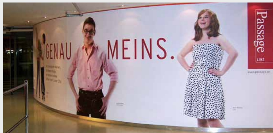
Matrix Frame®Flexibel, Wandverkleidung, 740 x 230 cm