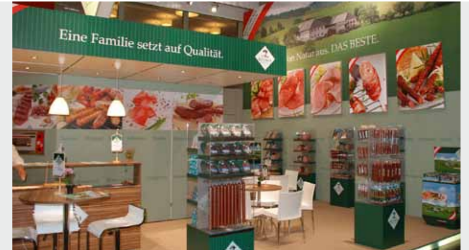
Matrix Frame®, Messestand, 700 x 500 cm