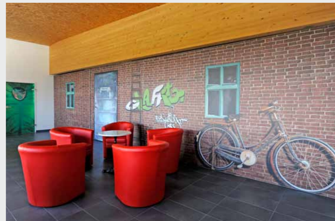
Matrix Frame®, Trennwand, 1000 x 250 cm